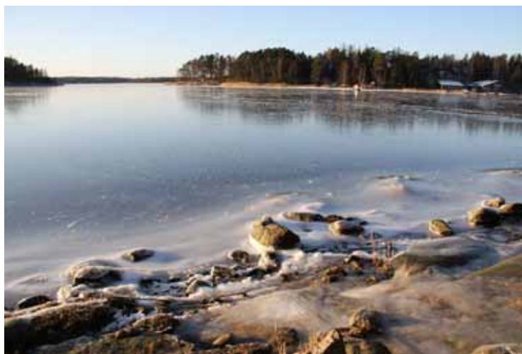
Lockande is på fjärden i slutet av december 2008

BÅTAR, JOLLAR, MASTER OCH TRAILERS PÅ AMIRALSHAMNSOMRÅDET SKA VARA MÄRKTA MED ÄGARENS NAMN OCH TELEFONNUMMER. AMHK